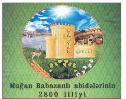
Muğan Babazanlı abidələrinin 2800 illiyi

Salyan rayonundakı Muğan arxeoloji mədəniyyətinin mərkəzi kimi tanınan Babazanlı ərazisində son illər aparılan araşdırmalar zamanı buradan 2800 il bundan əvvələ aid yaşayış məskənləri və maddi-mədəniyyət nümunələri aşkar edilmişdir.